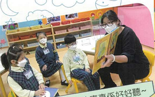
圖書館姨姨講嘅故事真係好好聽~