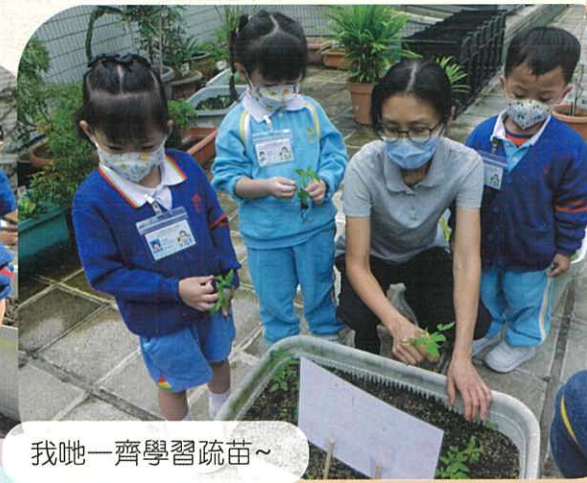
我哋一齊學習疏苗~