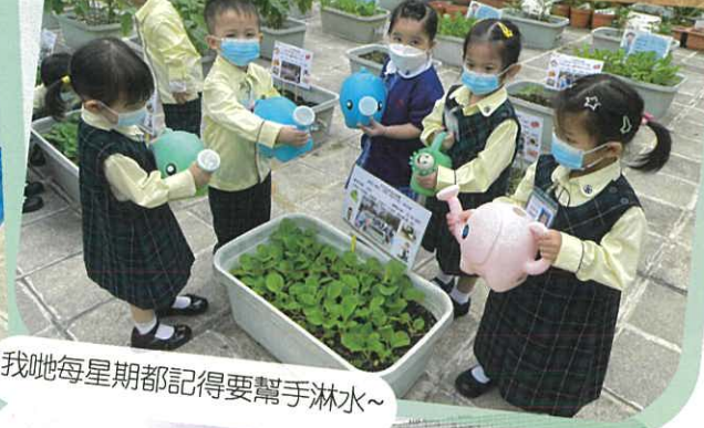
我哋每星期都記得要幫手淋水~