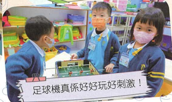
足球機真係好好玩好刺激！