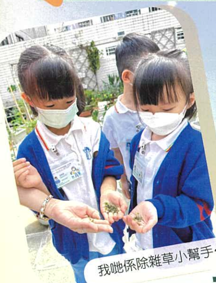
我哋係除雜草小幫手~