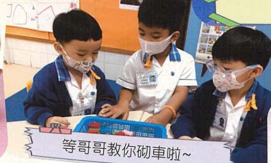
等哥哥教你砌車啦~