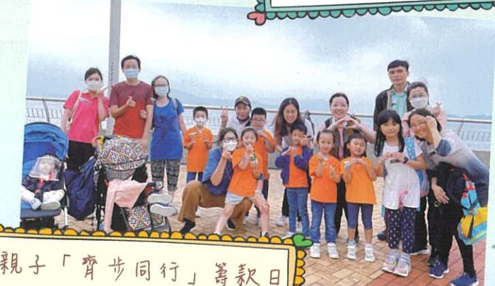
親子「齊步同行」籌款日