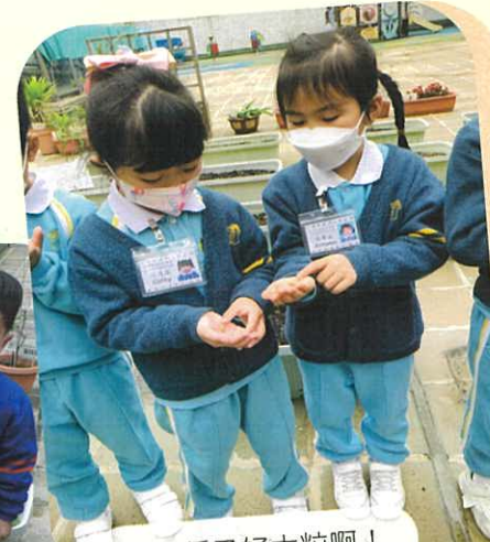
苦瓜種子好大粒啊!