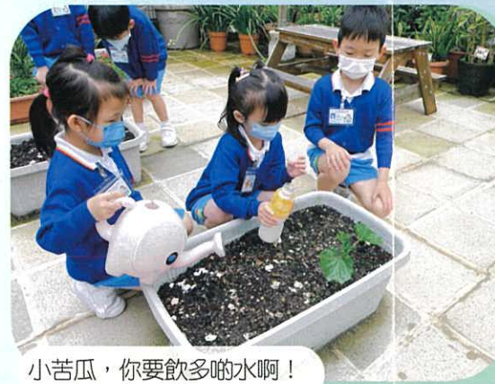
小苦瓜，你要飲多啲水啊!