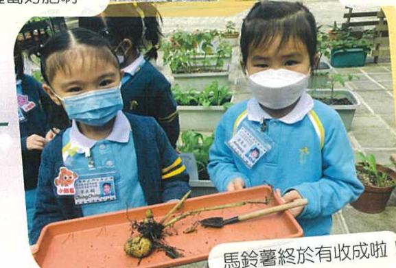
馬鈴薯終於有收成啦!