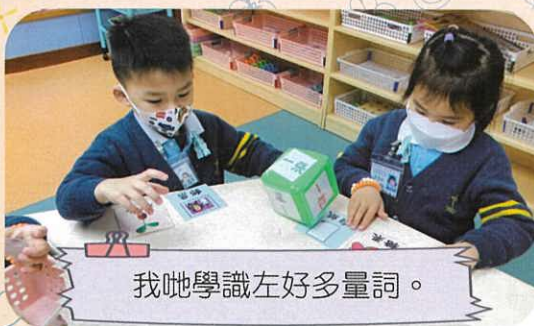
我哋學識左好多量詞。