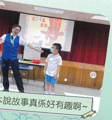
魔術繪本說故事真係好有趣啊~