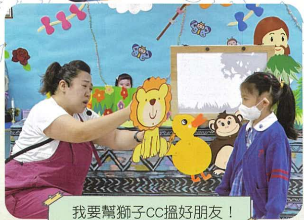
我要幫獅子CC搵好朋友！