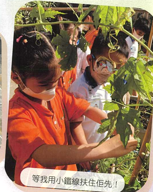
等我用小鐵線扶住佢先!