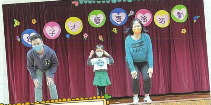
低班親子才藝表演