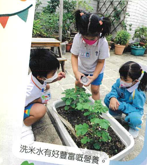
洗米水有好豐富嘅營養。