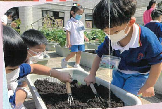
鬆鬆土就可以播種啦!