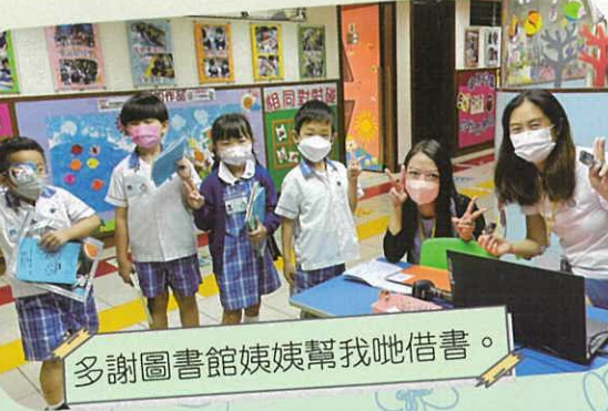
多謝圖書館姨姨幫我哋借書。