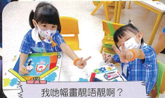
我哋幅畫靚唔靚啊？