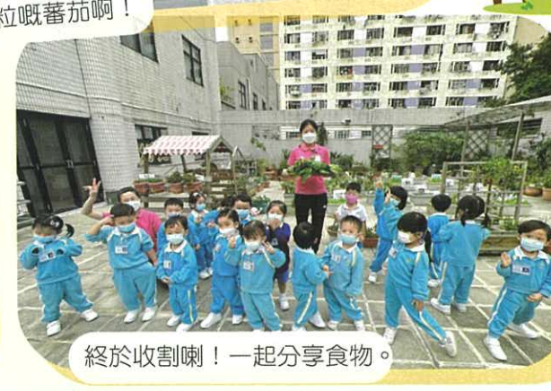
終於收割喇! 一起分享食物。