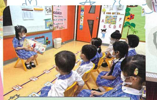
我最鍾意聽故事姐姐講故事！