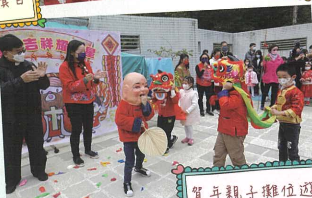
賀年親子攤位遊戲日