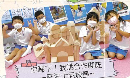
你睇下！我哋合作砌咗一座迪士尼城堡~