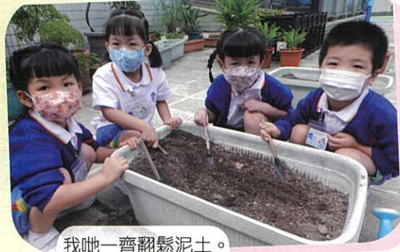
我哋一齊翻鬆泥土。