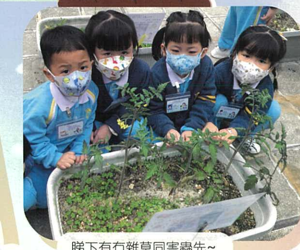
睇下有冇雜草同害蟲先~