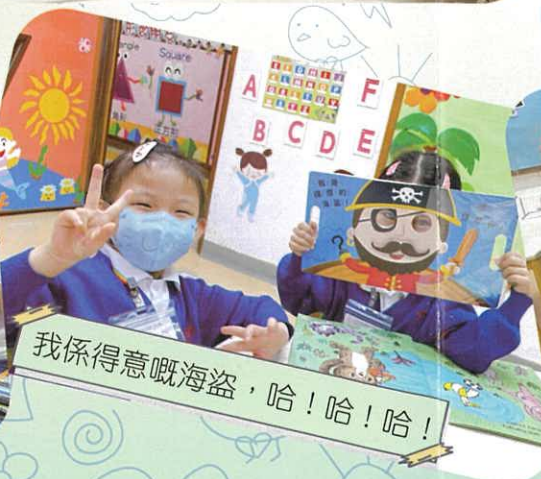
我係得意嘅海盜，哈！哈！哈！