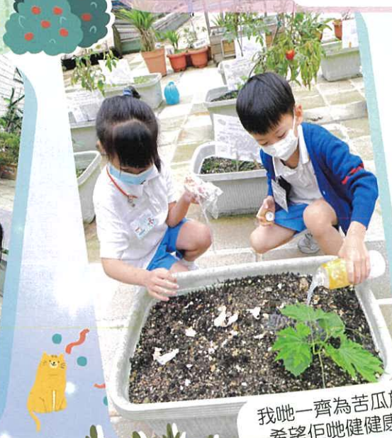
我哋一齊為苦瓜施肥，希望佢哋健康康康。