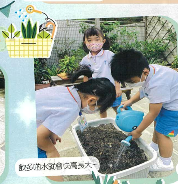
飲多啲水就會快高長大~