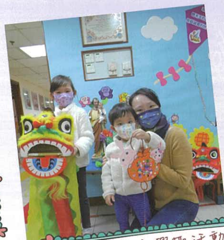
幼兒班親子興趣活動 「賀年掛飾製作」