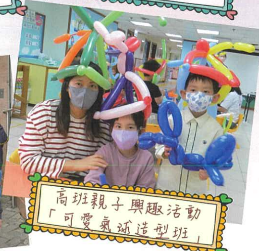
高班親子興趣活動 「可愛氣球造型班」