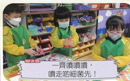
一齊噴噴噴，噴走啲細菌先！