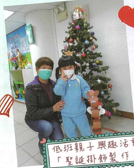
低班親子興趣活動 「聖誕掛飾製作」