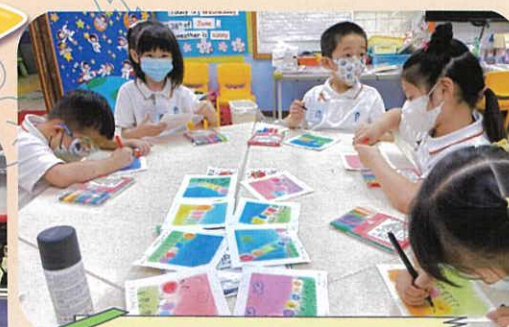
和諧粉彩美藝活動