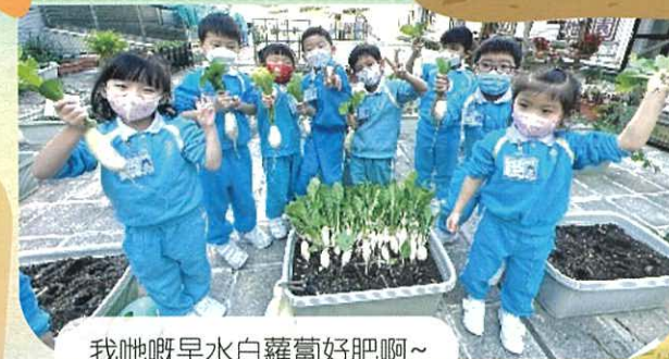
我哋嘅早水白蘿蔔好肥啊~