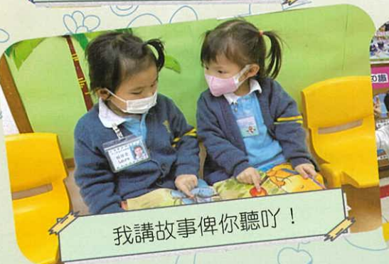
我講故事俾你聽呀！