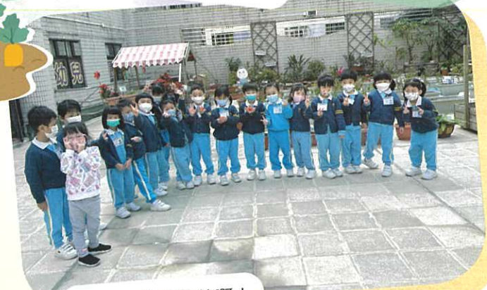
係好大粒嘅蕃茄啊!